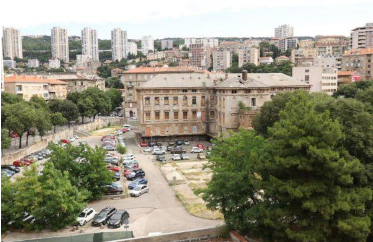
T-zgrada ex Rikard Benčić buduće sjedište Gradske knjižnice Rijeka

Projekt se provodi u sklopu Operativnog programa „Konkurentnost i kohezija 2014.-2020.“, Investicijskog prioriteta 6e „Aktivnosti kojima se poboljšava urbani okoliš, revitalizacija gradova, obnova i dekontaminacija nekadašnjeg industrijskog zemljišta (uključujući prenamijenjena područja), smanjenje zagađenja zraka i promocija mjere za smanjenje buke“, Specifičnog cilja 6e2 „Obnova brownfield lokacija (bivša vojna i industrijska područja) unutar ITU-a“.